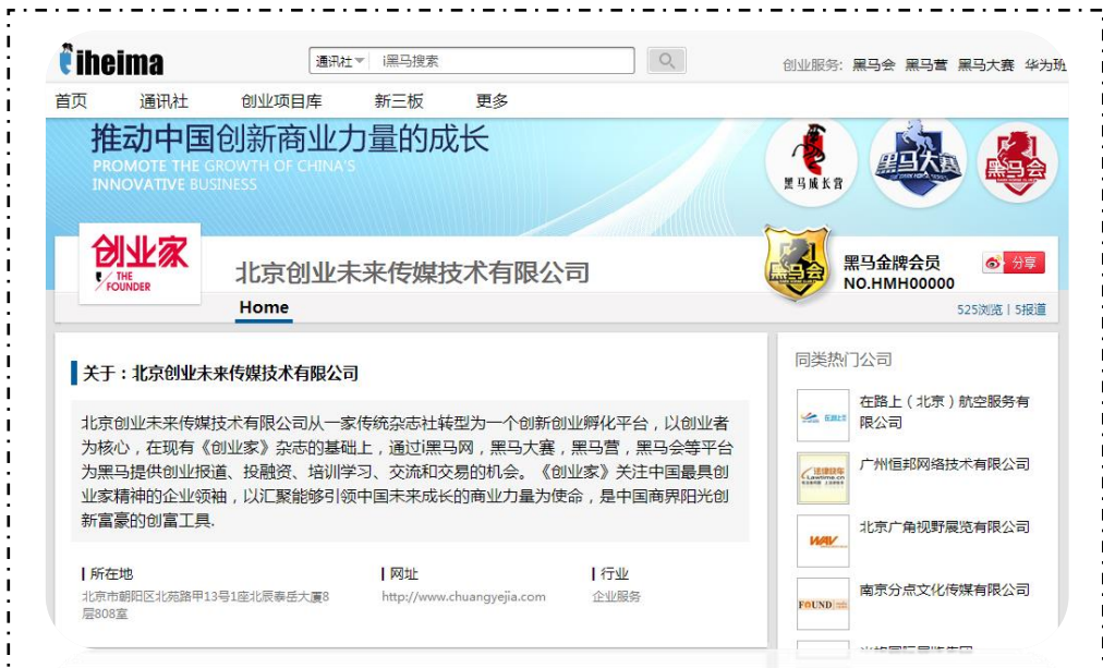
——图为企业户头界面效果图